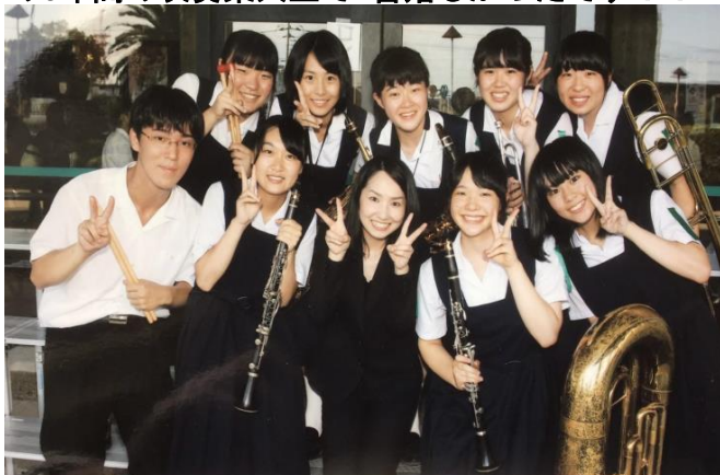
第54回 全日本吹奏楽コンクール山口県大会 平成27年7月31日～8月2日 / 周南市文化会館 7日～9日 / 新府市公会堂